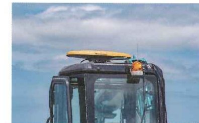
ミニバックホウに搭載されたVR500は、GNSSアンテナとコンパスが一体型のシンプルな仕様

岩崎のユニストロングは、ミニショベル向けのアンテナ一体型GNSSコンパスを採用したVR500と、中・大型向けのVR1000で、アンテナ分離型のGNSSコンパスを採用したものを用意。そしてカナモトはおなじみのE三・S。いずれも3Dマシンガイダンスシステムで、すでに所有しているバックホウに後付け可能な機器だ。