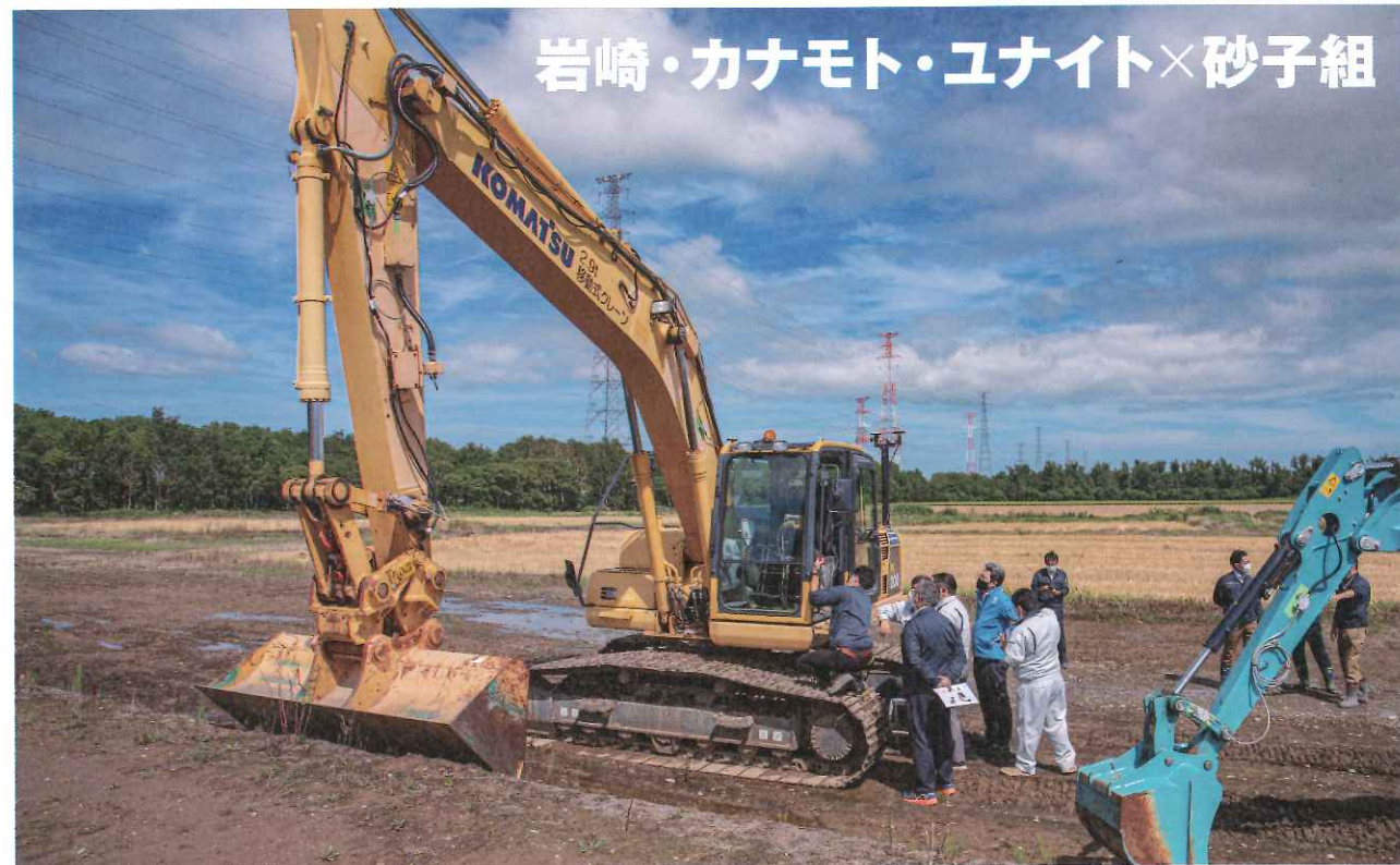
岩崎・カナモト・ユナイト×砂子組