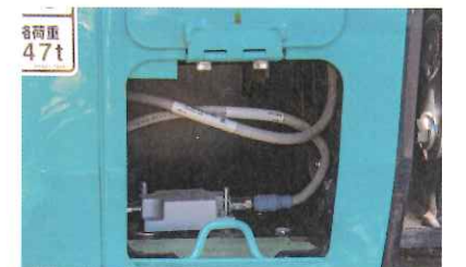
ユニストロングのVR500、VR1000ともにピッチセンサーが従来より小型化されているため、車内への収納も容易だ